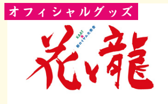
オフィシャルグッズ