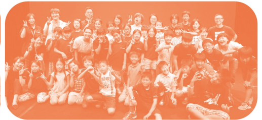
昨年(2016年)のワークショップの様子