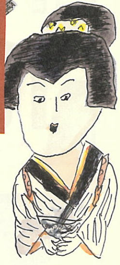
〔宣伝美術〕ささめやゆき