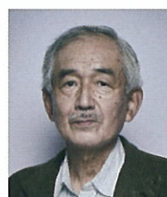
陪審員11号 しもじい