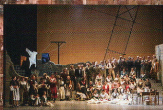
カヴァレリア・ルスティカーナ