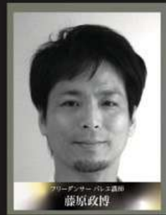
アーティスト 藤原政博