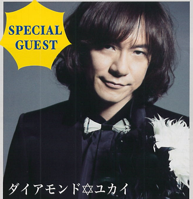
ダイヤモンド☆ユカイ